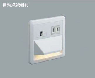
AB 39989 L