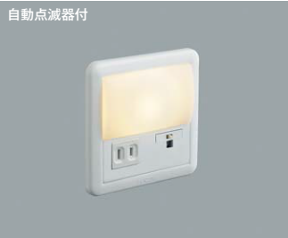
AB 39988 L