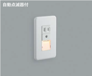
ABE 545 450