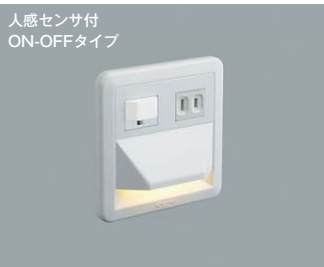
AB 39991 L