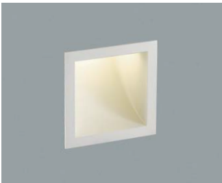
AB 42599 L