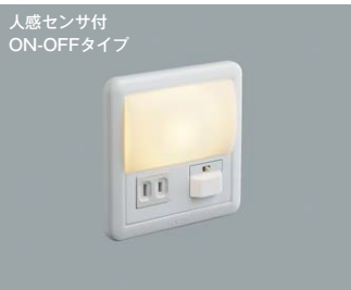
AB 39990 L