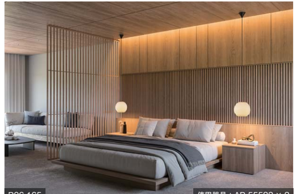
P06-165 使用器具：AP 55583 × 2

机上～器具下（左から）：約 750/1030mm・ピッチ：約 270mm（コード長は別注仕様）