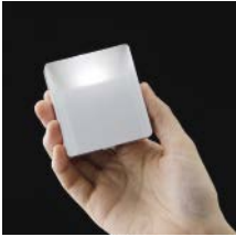
5000K 保安灯(非常灯)・携帯電灯使用時は、乾電池で点灯(単3電池同梱)