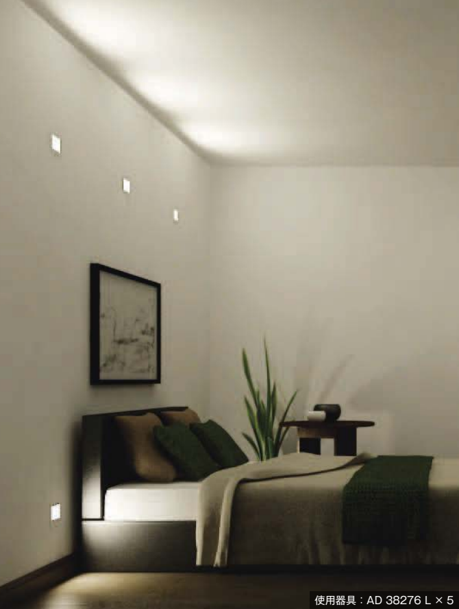
使用器具：AD 38276 L × 5

埋込部65mmの浅型タイプ。LEDパッケージが直接見えずに、間接光のみを取り出すグレアレス設計です。